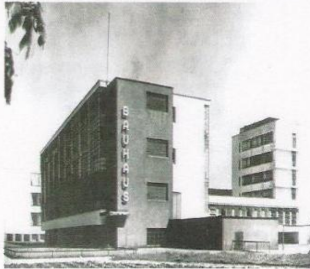
الشكل (3) مدرسة الباوهاوس للمعماري (Gropius)