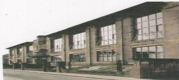
الشكل (1) مدرسة كلاسكو للفن للمعماري (Mackintosh)