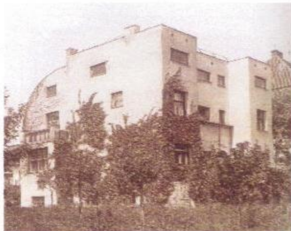
الشكل (2) مسكن شتاينر للمعماري (Loos)