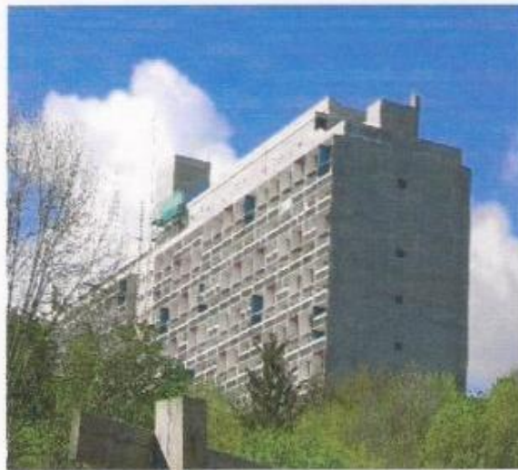
الشكل (6) وحدة مارسييليا للمعماري (Corbusier)