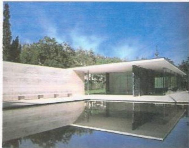
الشكل (4) معرض برشلونة للمعماري (Mies)